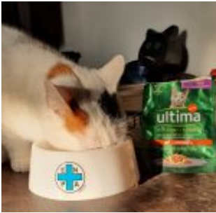
Oltre 90mila pasti per regalare un buon Natale anche ai pet più bisognosi