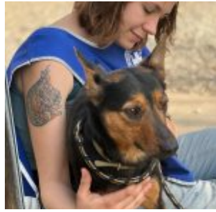
Ucraina: Ceva e Enpa insieme per i pet