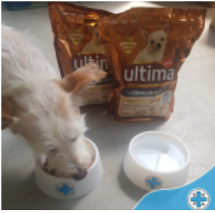
Ultima Petfood dona 65.000 pasti per aiutare i rifugi ENPA